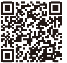
顔写真登録ガイド